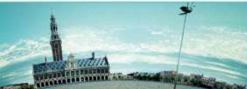
Alumni Lovanienses : e-mailaddresses